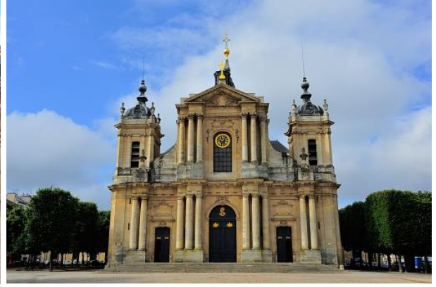
รายการทัวร์ที่น่าสนใจ ชมพระราชวังแวร์ซาย อพาร์ทเมนต์แห่งความลับ